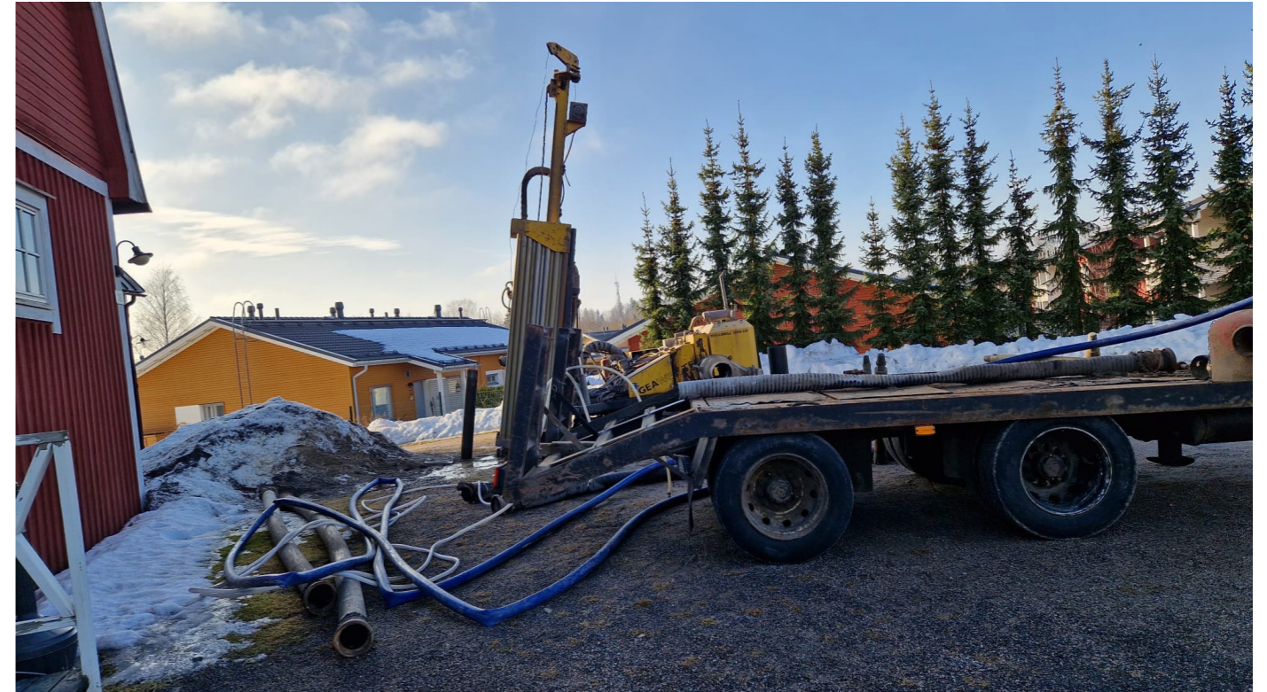
Renoveringen av värmesystemet vände upp och ner på både utsidan och insidan av huset. Gården återställdes med uppskattad hjälp av familjen Kylmööja.